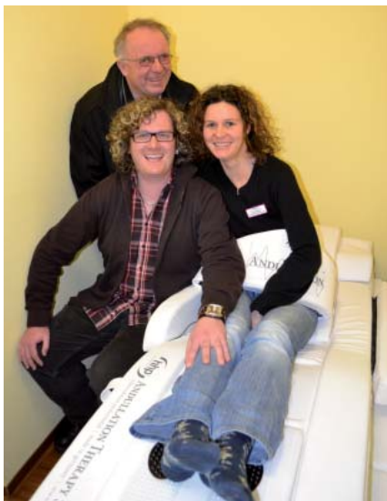
Text und Foto: Silke Meier

Aus Spenden an das Paul-Gerhardt-Haus konnte für die Mitarbeiter und die Bewohner eine Andullationsliege angeschafft werden. Andullation, das bedeutet, nicht nur Symptome zu behandeln, sondern die Ursachen beseitigen. Durch das biophysikalische Verfahren werden Schwingungen erzeugt, durch die im Körper die Funktionen normalisiert werden können. Der Stoffwechsel und die Durchblutung werden optimiert.